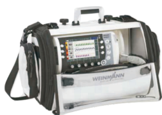
SYSTEM PRZENOŚNY LIFE BASE 4 NG

Wymienny akumulator, z możliwością ładowania zewnątrz lub wewnątrz z sieci 12 - 15 Volt DC lub 100-240 V AC, 50/60 Hz