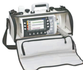
SYSTEM PRZENOŚNY LIFE BASE 1 NG