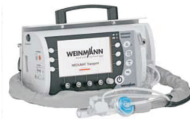
SYSTEM PRZENOŚNY LIFE BASE LIGHT